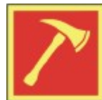
PB-05 20 x 20 Brannøk