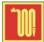
PB-04 20 x 20 Brannslange flat