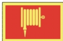
TB-07 30 x 20 Brannslange