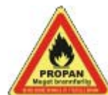
Pb-108 Propan 18 x 16