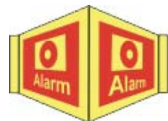
PB-19 20 x 20 PB-32 15x15 PB-104 10x10