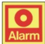
PB-03 20 x 20 Alarm