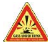
Pb-107 Gass under trykk 18 x 16