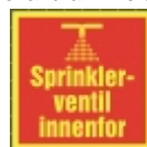
PB-109 20 x 20 Sprinklerventil Innenfor