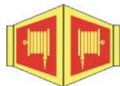
PB-17 20 x 20 PB-31 15x15