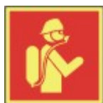
PB-07 20 x 20 Røykdykker