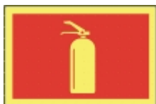
TB-01 30 x 20 Brannsløkter