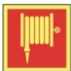
PB-06 20 x 20 Brannslange trommel