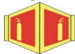
PB-18 20 x 20 PB-30 15x15