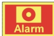
TB-21 30 x 20 Alarm