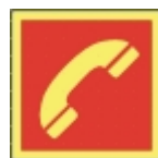
PB-09 20 X 20 Telefon