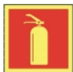
PB-08 20 X 20 Brannsløkter