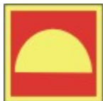
PB-01 20 x 20 Brannutstyr