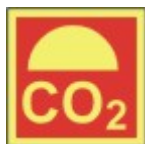
PB-11 20 X 20 CO2