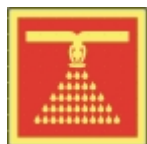
PB-25 20 X 20 Sprinkler